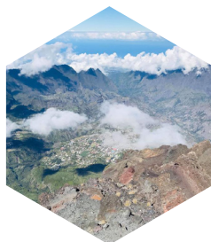
Les Cirques de la Réunion

Certains pharmaciens d'Outre-mer doivent affronter des situations d'insularité dans l'insularité et se mobilisent pour assurer l'accès au soin à tous . C'est le cas du pharmacien qui assure l'acheminement des médicaments jusqu'à l'île de la Désirade comptant moins de 1 500 habitants et dépendant administrativement de la Guadeloupe. L'île ne possède qu' une seule officine . Pour atteindre certains villages reculés de la Guyane , situés dans la forêt amazonienne, des pharmaciens effectuent eux le trajet en pirogue afin d'acheminer les médicaments et produits de santé aux habitants. Quant à la Réunion , ses différents cirques parfois très difficiles d'accès ne possèdent pas tous une pharmacie. Un pharmacien fait alors à pied la liaison entre les différentes habitations des cirques et apporte les produits de santé nécessaires à chacun.